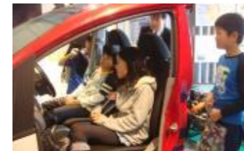
EVけいはんなエコシティ学習