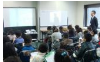
地球温暖化のビデオ学習

○近隣小中学校に「e2未来スクエア」へ来訪して頂き、地球温暖化の講義や発電実験等を通じて再生可能エネルギーの重要性や、眺望確認・EV試乗体験等で、楽しく体験できる環境学習(70分)を実施。