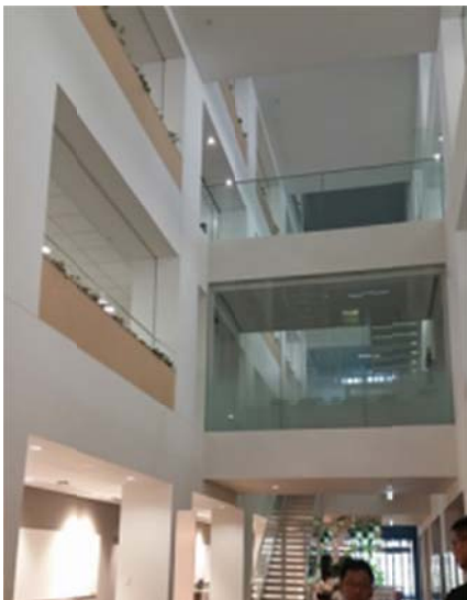
吹き抜け構造（6階建て）