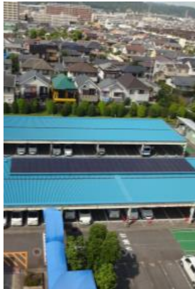
駐車場設置の太陽光パネル