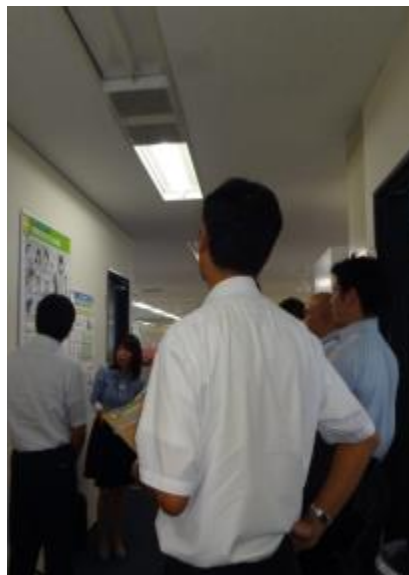
4階 執務フロアの見学 （IP電話の在籍状況に合わせた空調、天井シーリング）