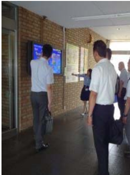
1階見える化サイネージ