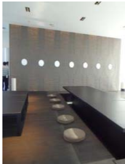
6F VIP応接室と景観（庭園風の屋上設備）