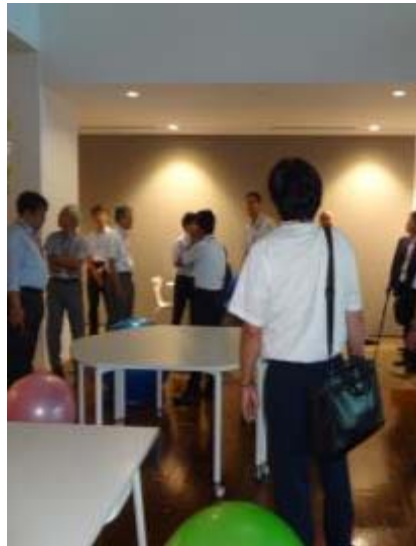
1階 リフレッシュスペース（執務中も使用可）