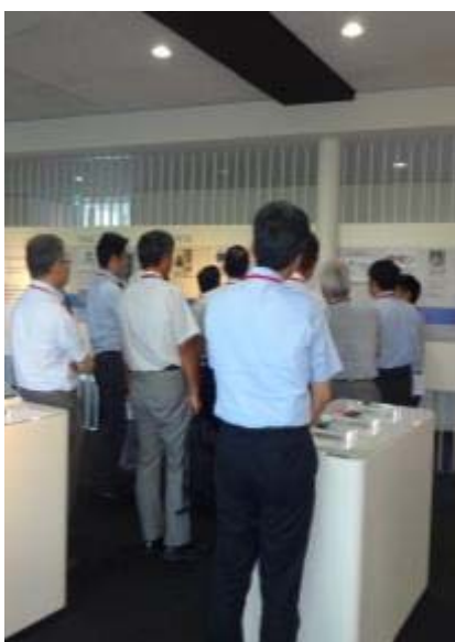
1階 展示室での見学