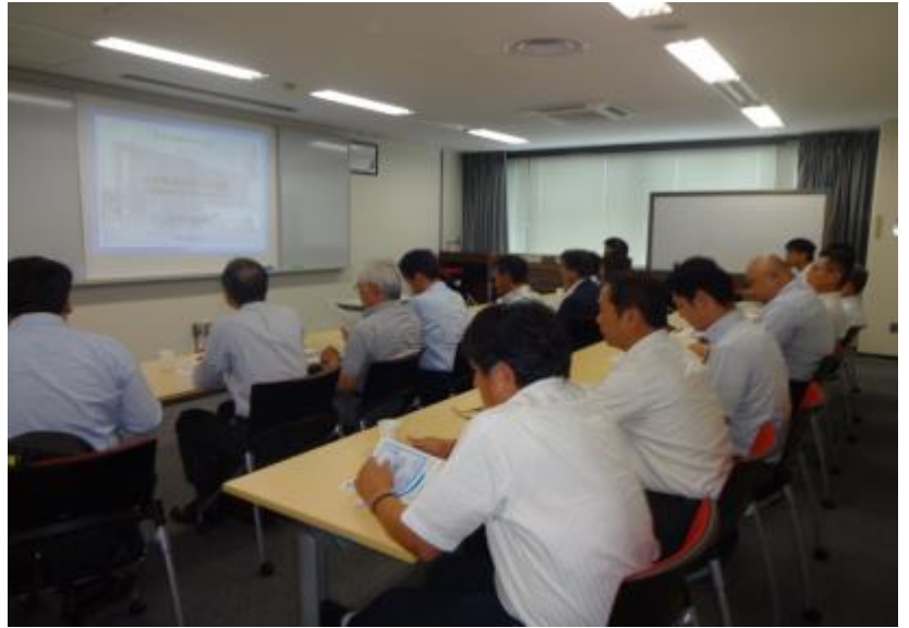
OGBCアテンダントによる概要紹介（施設設備と行動観察手法等）