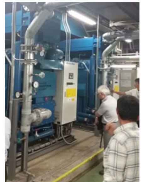
排熱投入型冷温水機