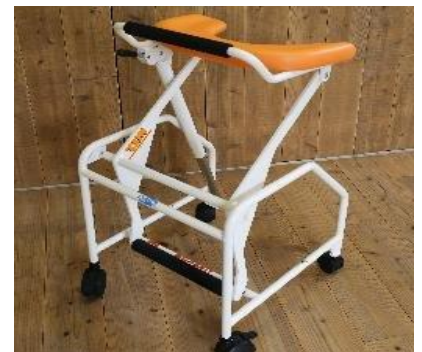
同社オリジナル歩行器 “たあ〜くん”

“たあ〜くん”は、梃子の原理を応用した簡素な構造で、介護する人、介護される人の双方にとっての使いやすさを第一に考えて造られた歩行器です。