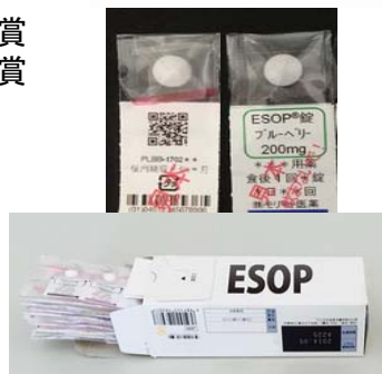
図1. 次世代錠剤包装「ESOP」