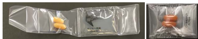
図2-1. GT剤サプリ (折込んだ状態)