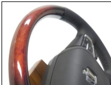
自動車用ハンドル