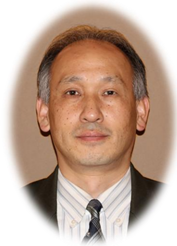
帝塚山大学現代生活学部 食物栄養学科教授、学科長