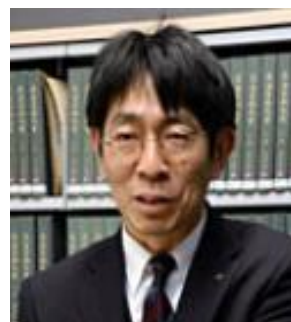
京都府立 京都学・歴彩館 資料課 課長補佐

また、最新の電気、機械、土木工学により整備された明治京都のインフラや交通機関についても取り上げ、先人たちの叡智に触れていただく機会とします。