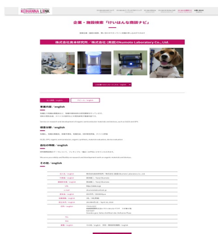
けいはんな商談ナビ