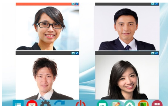
けいはんな Online Cafe