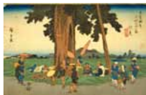
広重 画「木曾海道六拾九次之内伏見」 (請求記号 寄別2-2-1-5) ※弁当を食べている場面。

詳細は https://www.ndl.go.jp/jp/kansai/events/index.html に掲載予定