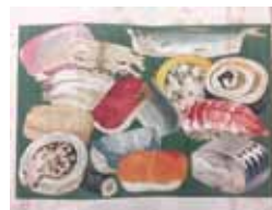
小泉清三郎 (汪外) 著「家庭庭のつけかた」 大倉書店、明43.7(請求記号 246-213)