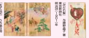
明治館蔵 「本の玉手箱」 70周年記念 展示

詳細は http://www.ndl.go.jp/kansai/events/index.html に掲載予定