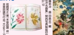
伊藤若冲 画田志編 「花の巻」 国立国会図書館蔵 3710 「花の巻」 国立国会図書館蔵 3710

詳細は http://www.ndl.go.jp/kansai/events/index.html