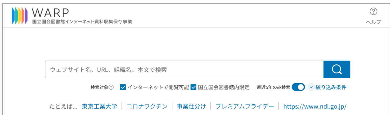
図1 WARP のトップページ

国立国会図書館は、令和7年12月25日（木）に、「国立国会図書館インターネット資料収集保存事業（Web Archiving Project : WARP）」のウェブサービス ( https://warp.ndl.go.jp/ ) をリニューアルしました。