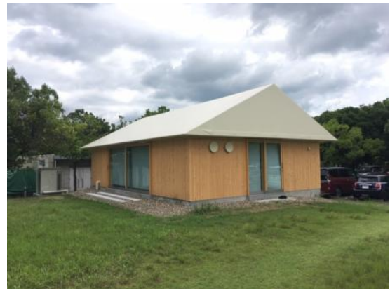
図1 DAC小型試験装置の模式図とその専用実験棟(RITE敷地内)の外観