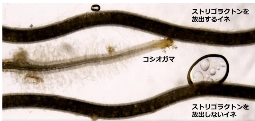
ストリゴラクトンを放出するイネの根に向かって根を伸ばすコシオガマ

本研究は、オンライン科学雑誌『 Nature Communications 』（8月15日付）に掲載されました。