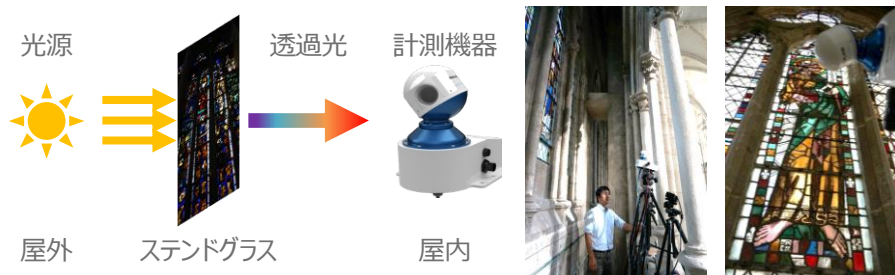
図 1 : 計測の様子