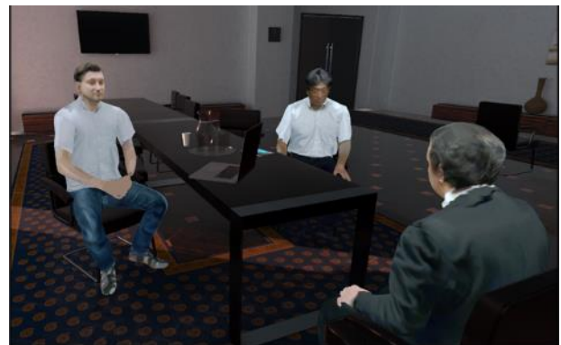
図 3: 仮想空間内で互いに向き合い、各人の表情・動作を豊かに伝えて相互理解の深化が図れる将来の遠隔コミュニケーションに活用