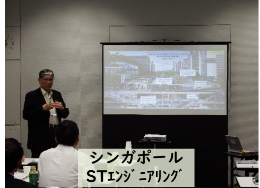
シンガポール STエンジニアリング