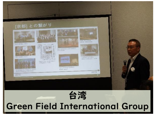
台湾 Green Field International Group