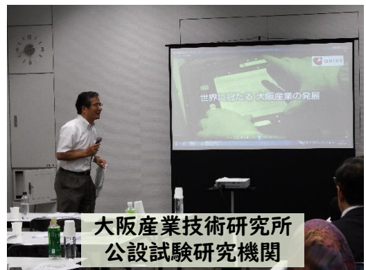
大阪産業技術研究所 公設試験研究機関