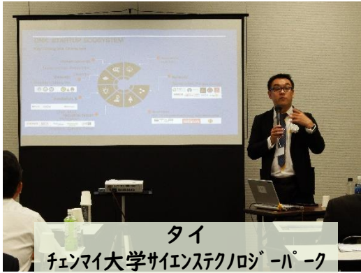
タイ チェンマイ大学サイエンステクノロジーパーク