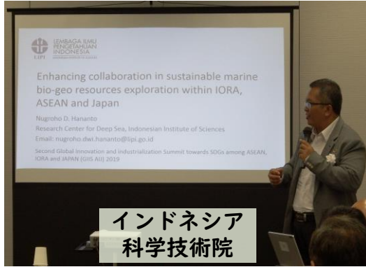
インドネシア 科学技術院