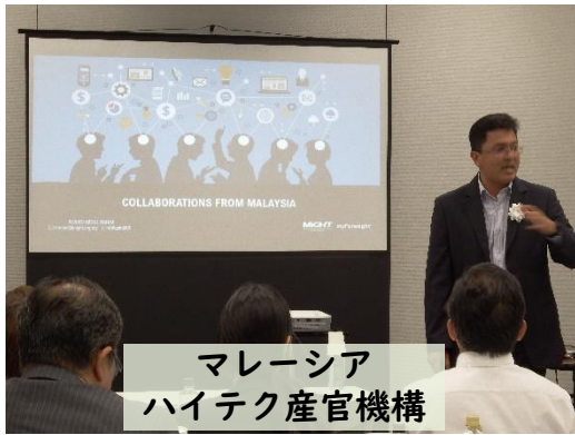
マレーシア ハイテク産官機構